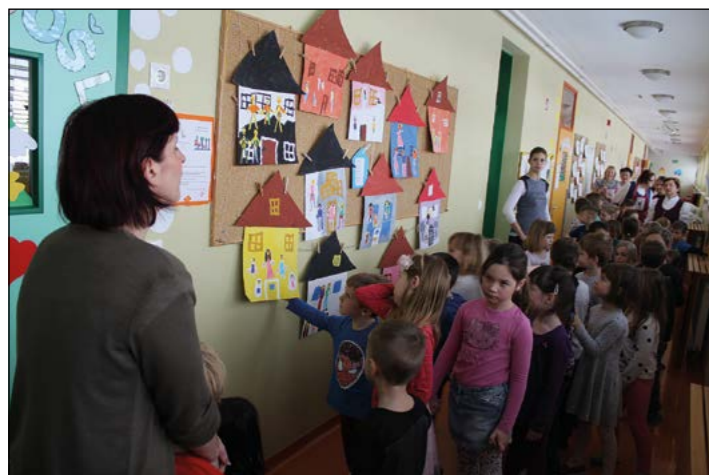
Ogled vrta in razstave slik, ki so delo varovancev.