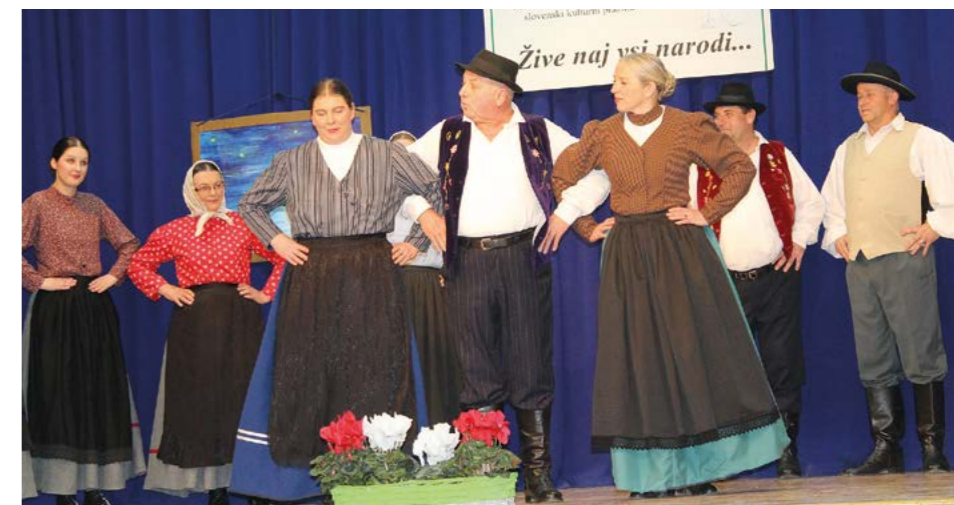
Folklorna skupina je nova pridobitev hajdinskega kulturnega društva.