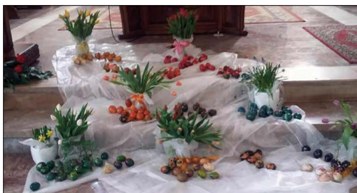
Pisanke v cerkvi sv. Martina na Hajdini

Pripravili so slikovito razstavo pisank in jih dali na ogled vernikom v cerkvi sv. Martina na Hajdini. Tudi mnogi FB-prijatelji so se navdušili nad njihovo barvitostjo in domselnostjo, s katero so se izkazali tisti, ki poleg klasičnega načina krašenja pisank želijo narediti še nekaj izvirnega. Poleg članov TD se je v knjigo razstavljalcev vpisalo še pet nečlanov, ki pa bodo morda sčasoma začutili pripadnost enemu najmlajših društev v občini Hajdina.