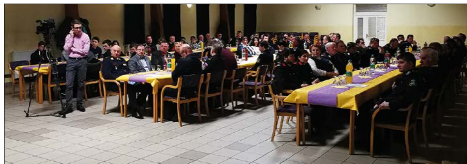
V Dražencih so se gasilci zbrali na 32. delovnem srečanju.