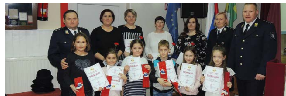
Novi člani PGD Hajdina. Čestitamo!