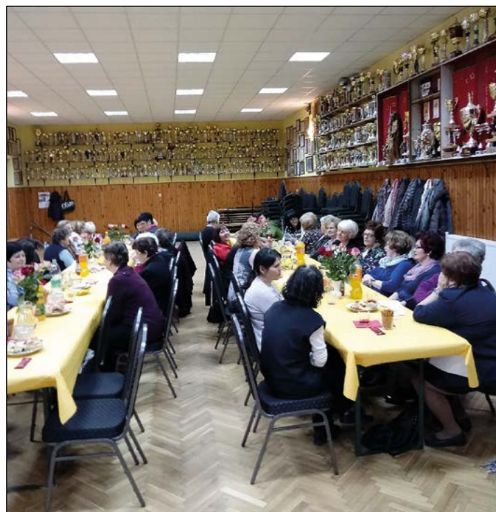
Hajdošanke so se že po tradiciji zbrale na dan žena.

Članice Društva žensk Hajdoše so se tudi letos zbrale in skupaj proslavile 8. marec – dan žena. To je že dolgoletna tradicija, ki se je ohranila.