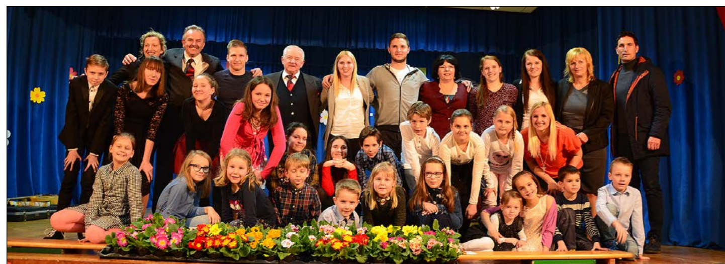
Utrinki s proslave v Hajdošah.