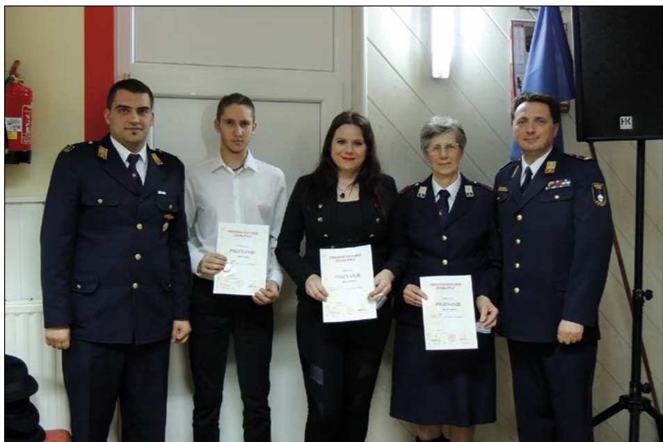
Prejemniki značke za dolgoletno delo v gasilstvu v družbi podeljevalcev