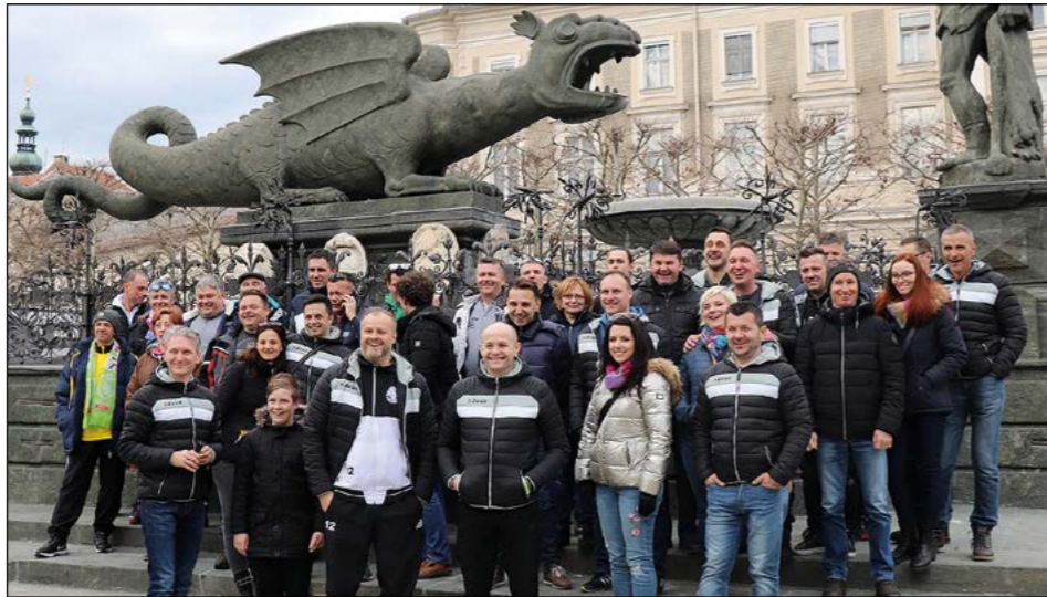
Pred celovškim zmajem na Novem trgu v središču Celovca

Kljub odpadli tekmi z veterani SAK so hajdinski veterani svoj del naloge na