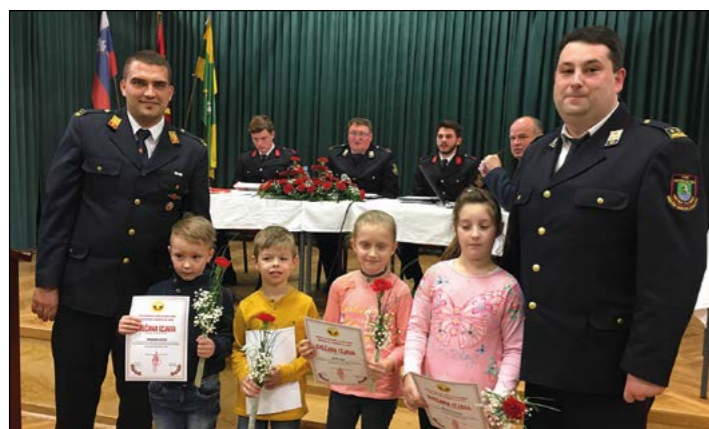
Novi člani PGD Gerečja vas