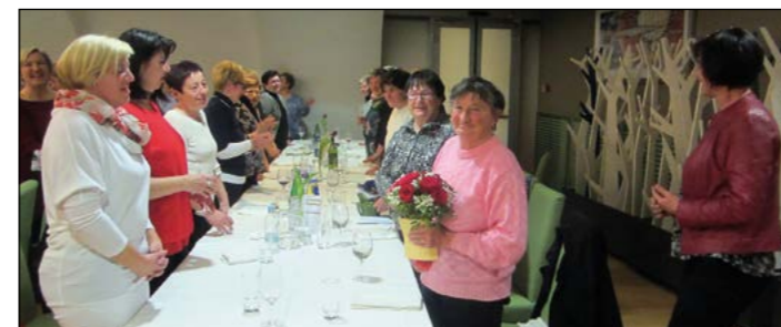
Z veseljem so si ogledale tudi zdravilišče Thermana Laško.