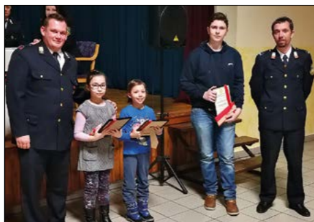
V PGD Draženci so posebej veseli gasilskega podmladka.