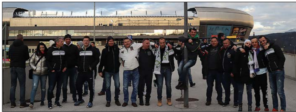
Ekipi veteranov Hajdine, ki sta se namesto predvidene tekme s SAK Celovec merili med sabo.