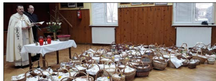
Košarice z dobrotami pri blagoslovu