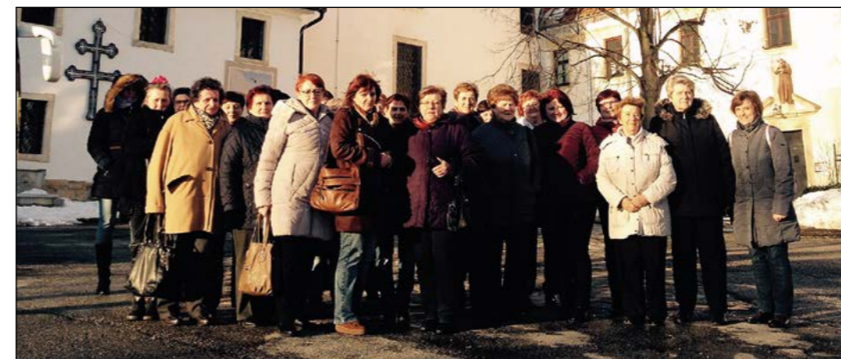
Skupna spominska fotografija izletnic pred cerkvijo sv. Trojice

Članice DŽD Gerečja vas so se ob prazniku dneva žena tudi letos podale na kratek popoldanski izlet in večerno druženje. Tokrat jih je pot zapeljala v kraj Sveta Trojica v Slovenskih goricah.