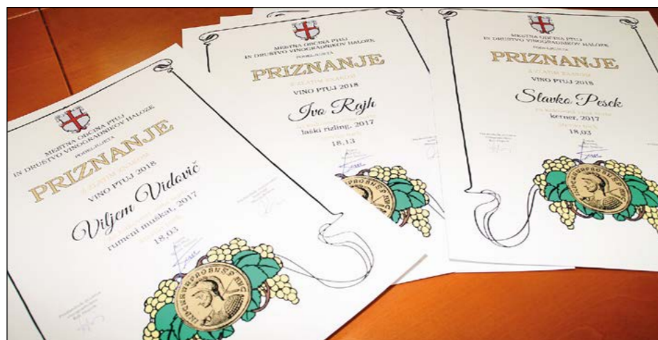
Na Ptuj so bila že osemindvajsetič podeljena vinska odličja.

Viljem Vidovič s Hajdine je za rumeni muškata (ocena 18,03) prejel zlato priznanje. Slavko Pesek iz Dražencev je za kerner (ocena 18,03) prejel zlato priznanje, prav tako pa je zlato priznanje prejel tudi za zvrst (ocena 18,20). Ivo Rajh iz Dražencev je za laški rizling (ocena 18,13) prejel zlato priznanje, prav tako zlato tudi za sauvignon (ocena 18,17), za renski rizling (ocena 15,80) pa priznanje za sodelovanje. Nagrajene vinarje na Vino Ptuj je nekaj dni po podelitvi na sprejem povabil