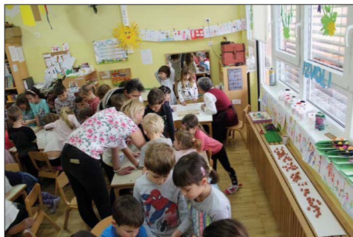
Na koncu še reševanje igre ...

Srečanje je bilo posvečeno projektu Tudi jaz sem del kulture in turizma, v okviru katerega je bilo v sredo, 11. aprila, tudi odprtje likovno-fotografske razstave v razstavišču Poslovno-stanovanjskega centra na Hajdini.