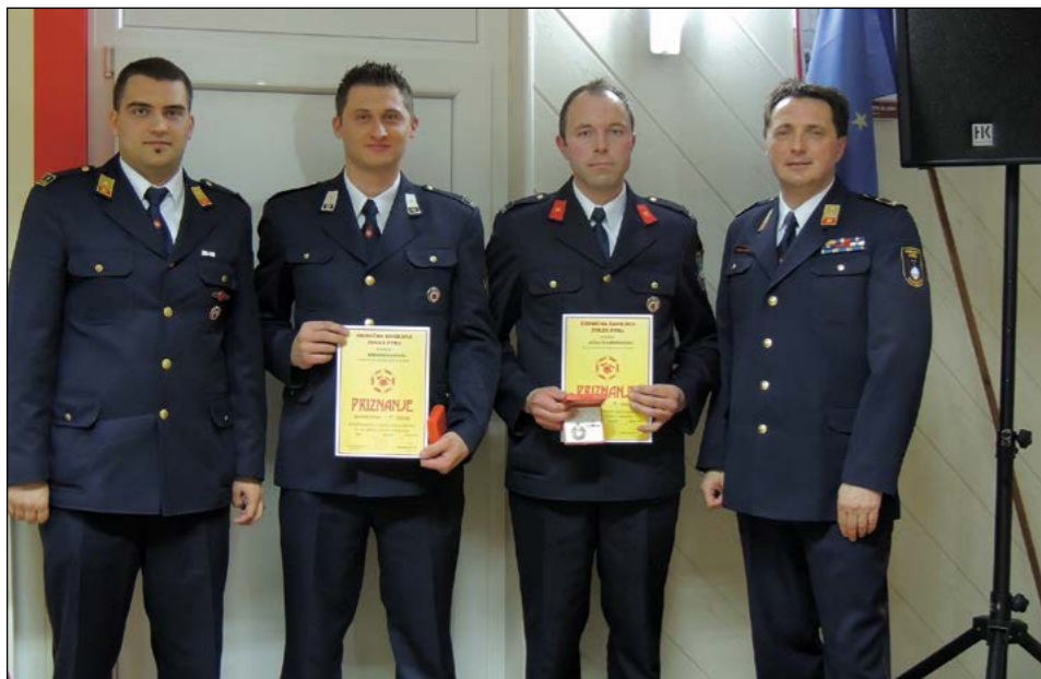
Prejemnika priznanja OGZ Ptuj