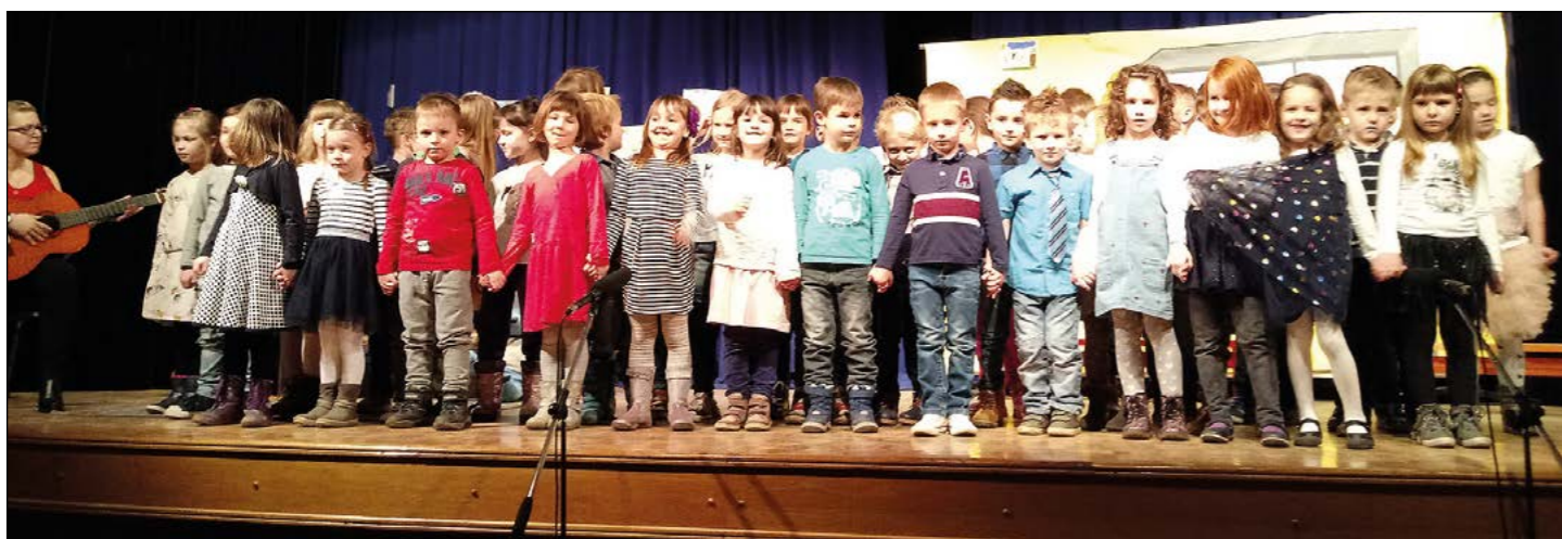
Vrtčevski zborček Mavrica raja

porajale, je predstava vedno bolj dobivala svojo končno podobo.