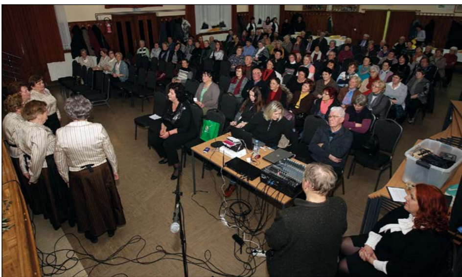
Danes obletnico rojstva praznuješ, so zapele Hajdinske frajlice ter poskrbele za presenečenje predavateljice in občinstva.