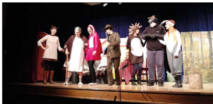
Starši otrok so zaigrali v predstavi Rdeča kapica.