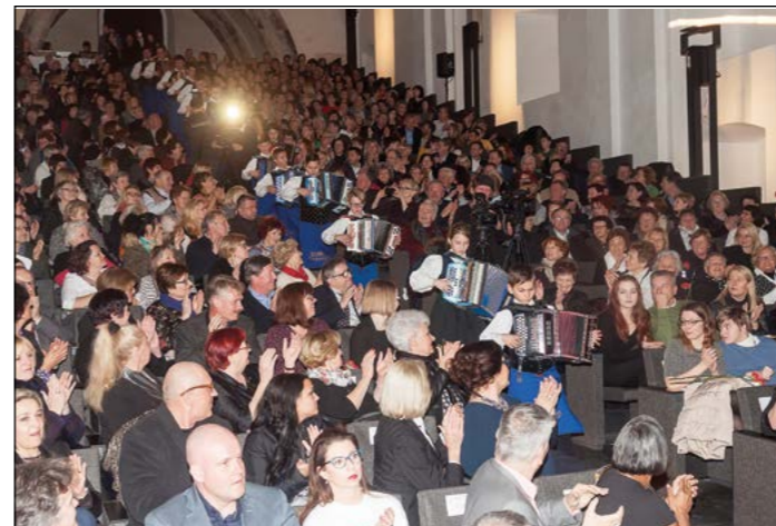
Zadnji prihod Štajerskih frajtonarjev na oder z legendarno skladbo Na Golici