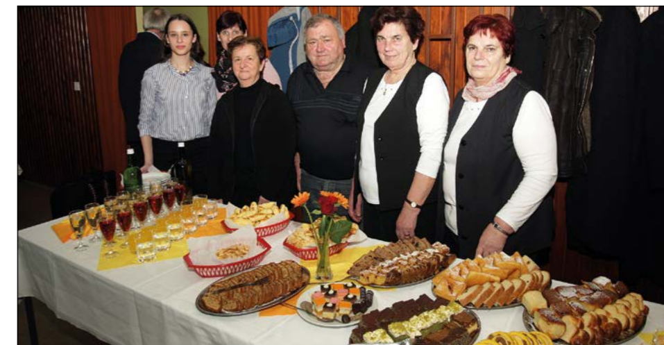
Ekipa, ki je iz ozadja skrbel za dvorano pa tudi za to, da je na mizah nastala prava mala razstava dobrot izpod rok pridnih gospodinj iz hajdinske občine ter kapljice »belega in rdečih kletarjev« iz Skorbe.