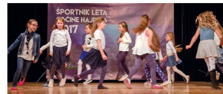
Plesna šola Power Dancers – starejša skupina iz OŠ Hajdina