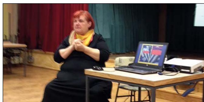
Predavateljica je predavanje podkrepila tudi z raznoliko slikovno dokumentacijo.