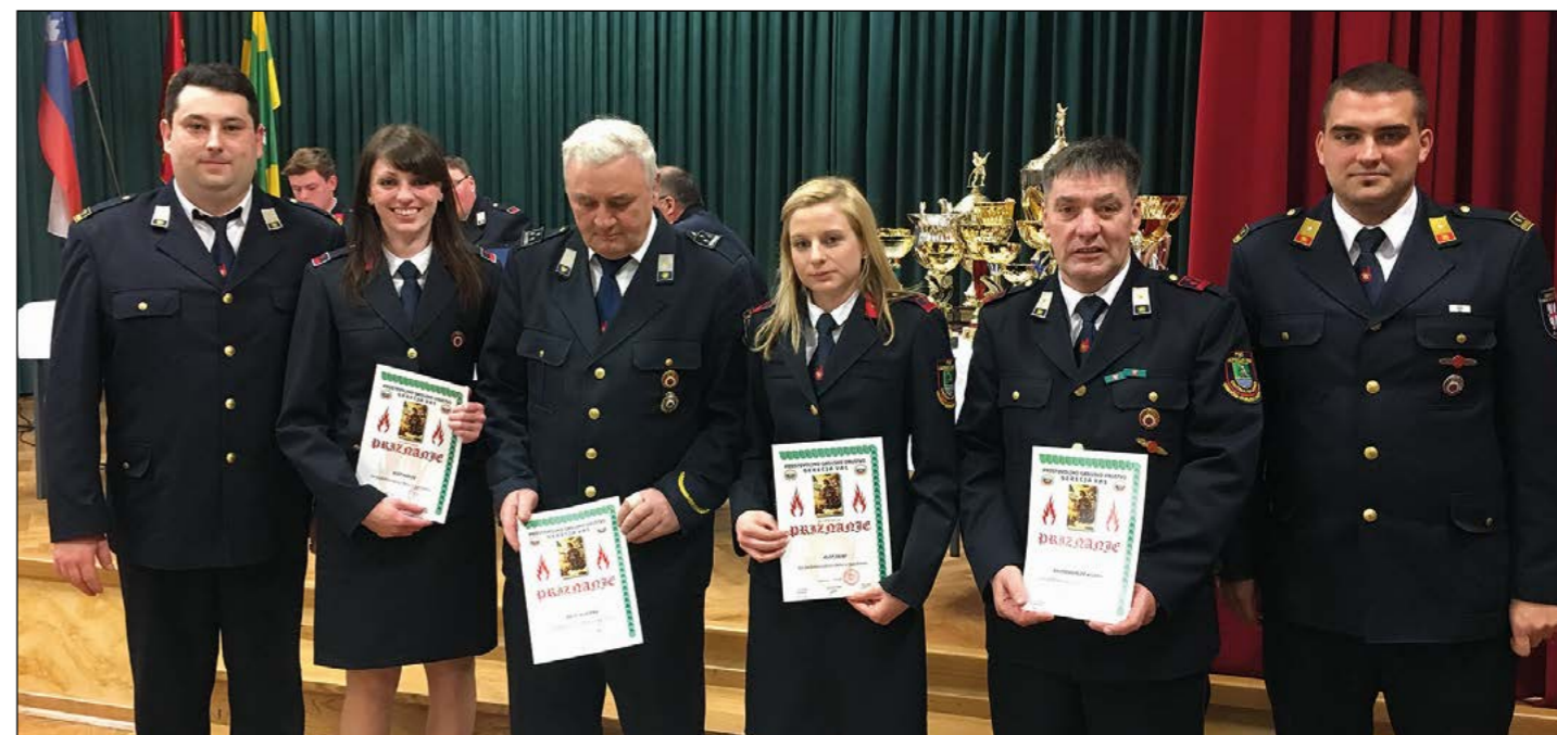
Letošnji nagrajenci, dobitniki jubilejnih priznanj in napredovanj v višje čine