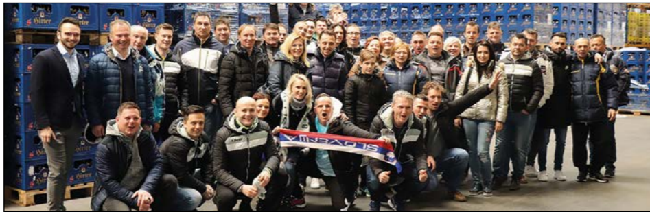
V pivovarni Hirter so nas prijazno sprejeli, popeljali po vseh obratih, v skladišču pa smo pripravili malo navijaško pokušnjo.