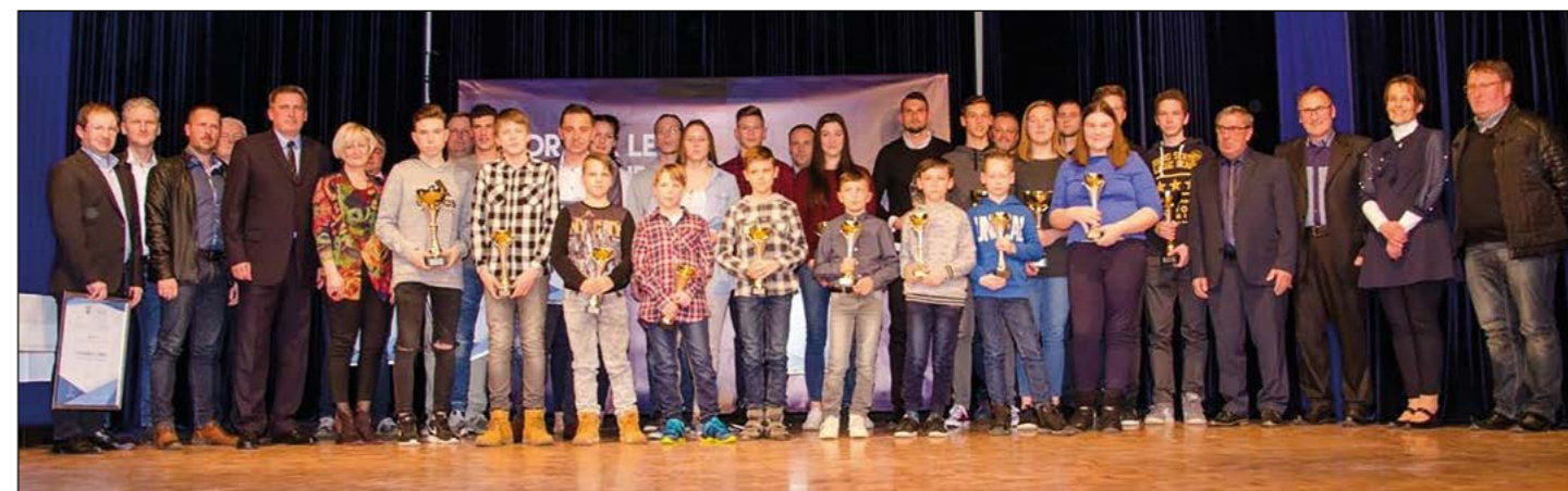
Skupinska fotografija nagrajencev na prireditvi Športnik leta 2017 Občine Hajdina