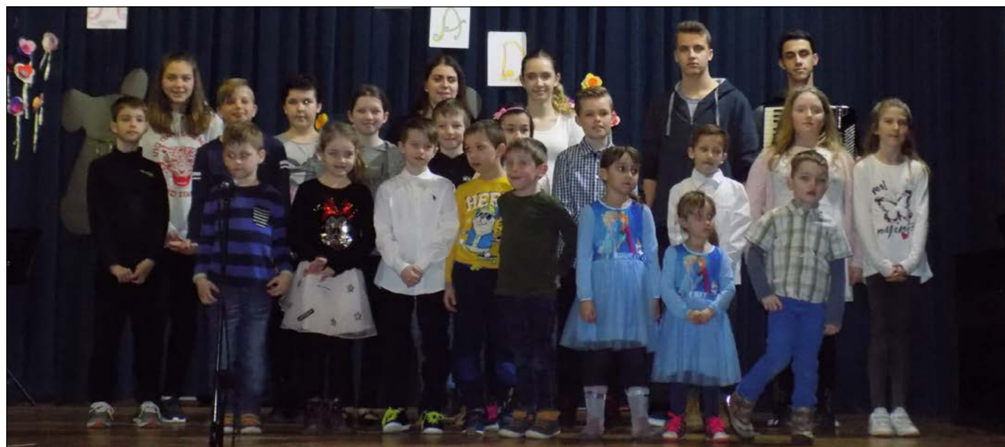
Utrinki s proslave v Dražencih