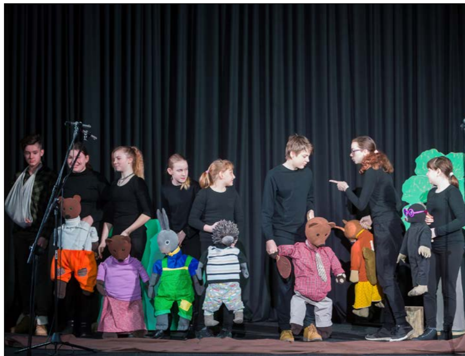
Hajdinski lutkarji so se predstavili tudi na območni reviji lutkovnih skupin.