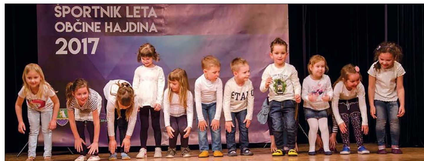
Nastopila je mlajša skupina Plesne šole Power Dancers.