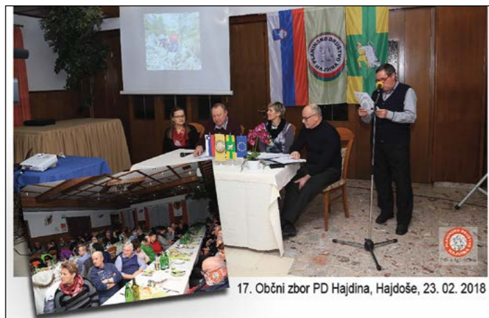
17. Občni zbor PD Hajdina, Hajdoše, 23. 02. 2018