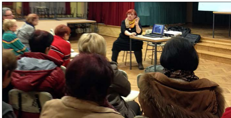
Predavanja o pridelavi jušne zelenjave se je udeležilo lepo število članic DŽD Gerečja vas.