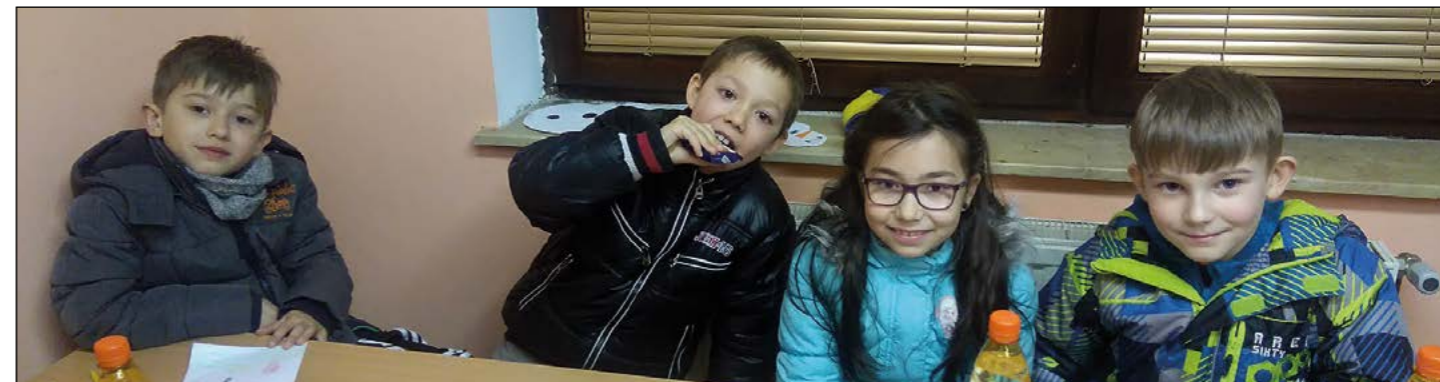
Utrinek z druženj z mladimi gasilci v Dražencih

Pionirjem v PGD Draženci tako poskušamo na čim več načinov prikazati delovanje društva. V tem prehodnem času, ko nam vremenske razmere niso najbolj dopuščale, da bi lahko zunaj vadili za pionirska tekmovanja, smo se z našimi najmlajšimi zaposlili nekoliko drugače. S področja operative smo spoznavali opremo v gasilskih avtomobilih in zaščitno opremo gasilca.