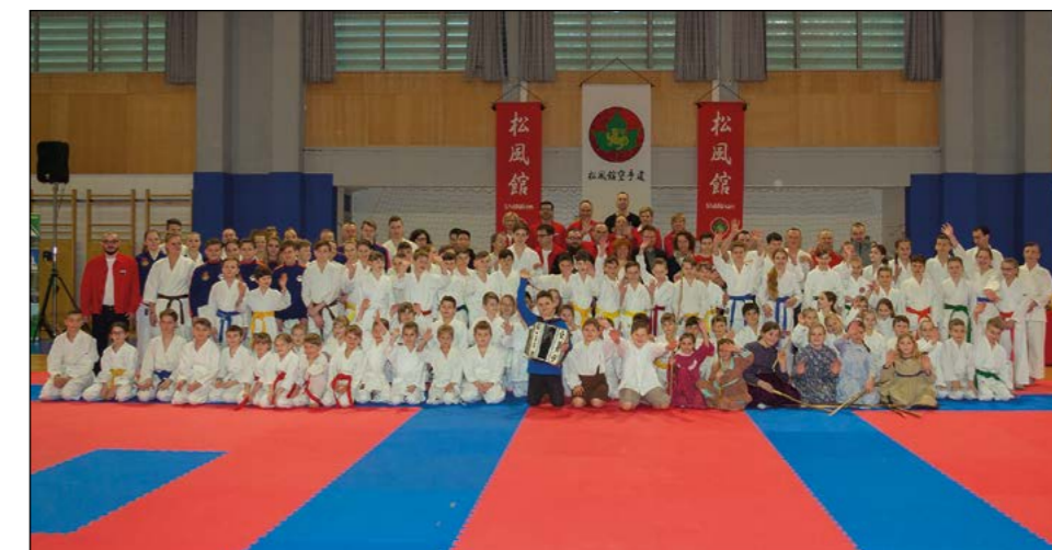
Utrinka s tekmovanja v Šentilju