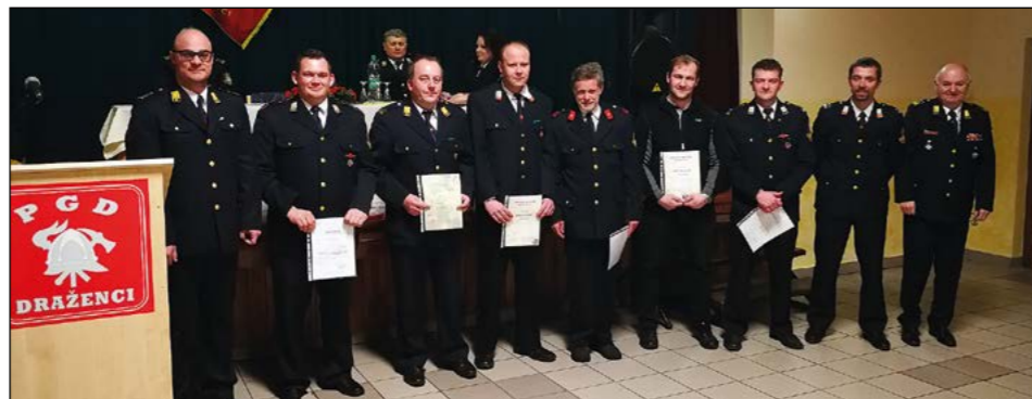
Letošnji nagrajenci v družbi podeljevalcev