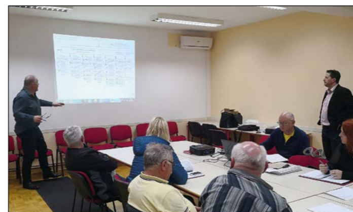
V OGZ Ptuj so priprave na kongresni dogodek v polnem teku.

V zadnjih tednih se je na Ptujju sestel tudi širši organizacijski odbor, vodstvo OGZ Ptuj pa je predstavilo glavna navodila pred velikim majskim dogodkom, predstavljena pa je bila tudi vsebina s programom dvodnevne dogajanja na Ptujju. Veliko dela je sicer že opravljenega, glavnina pa šele prihaja in s tem številne obveznosti, ki čakajo okrog 300 prostovoljnih gasilcev na Ptujskem, ki so vključeni v organizacijo gasilskega kongresa.