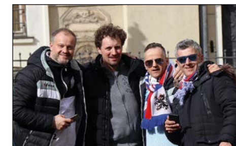
V Celovcu nas je pričakalo sončno vreme.