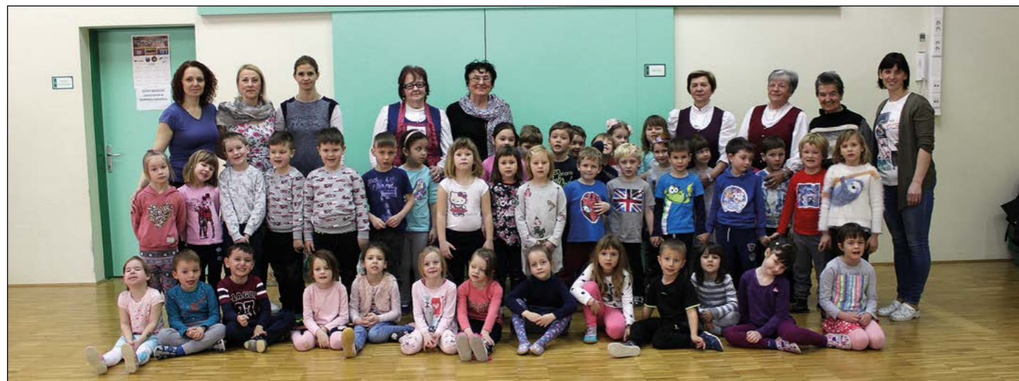
Po koncu vseh aktivnosti še vrtničarsko poziranje za zgodovino otroštva naših nadobudnežev