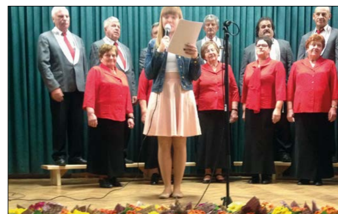
S pesmimi je proslavo popestril tudi domači MePZ DŽD Gerečja vas.