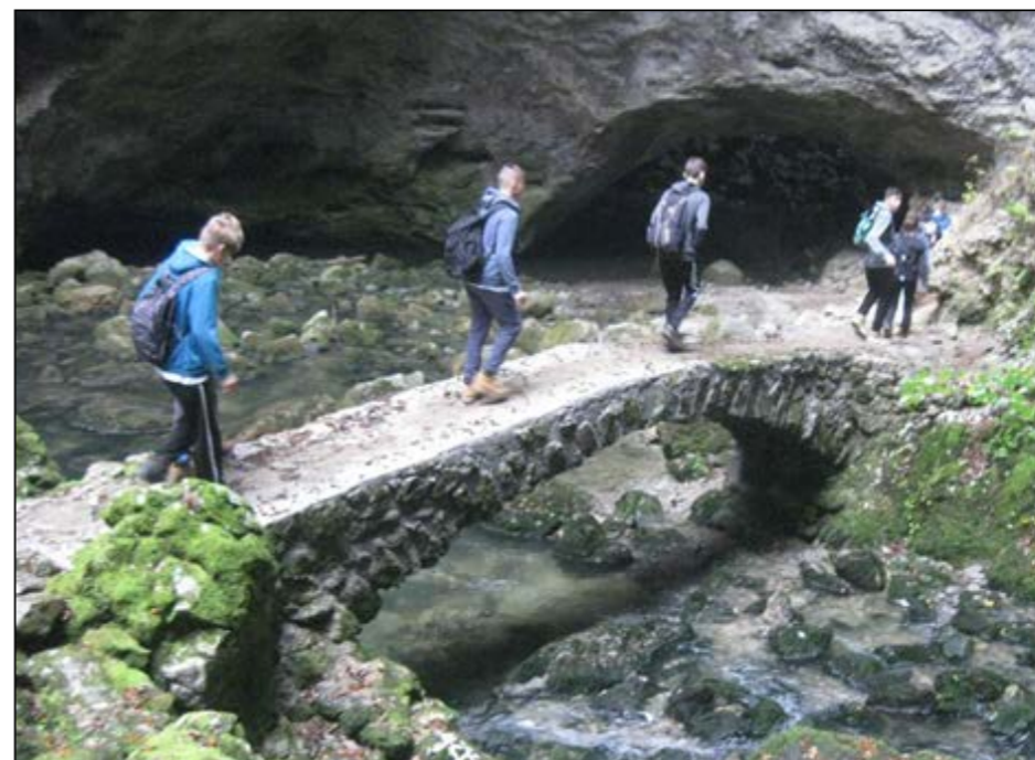
Devetošolci na taboru v Rakovem Škocjanu, kjer je del stroškov kril tudi šolski sklad.

V šolskem skladu Osnovne šole Hajdina z enoto vrtec smo aktivni tudi v tem letu, z veseljem pa se ozremo tudi na lanske dosežke. Pri tem gre izpostaviti predvsem nova zunanja igrala za naše najmlajše v vrtcu in zunanje telovadno plezalo za šolarje. Že tradicionalno smo pomagali tudi staršem pri financiranju šol v naravi, plavalnih tečajev in taborov.