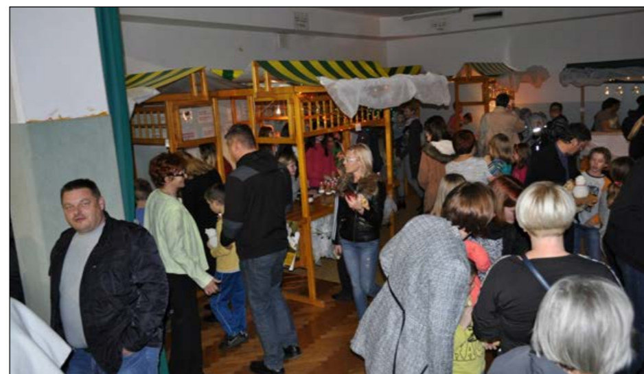
Utrinek s šolskega bazarja

Šolski sklad deluje v okviru šole in ga skupaj upravljamo predstavniki staršev, šole in vrtca. Namen sklada je predvsem financiranje vseh tistih dejavnosti vrtca in šole, ki povečujejo kakovost pouka ali varstva, ga nare-