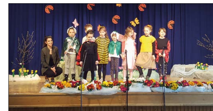
V Skorbi so tudi letos združili praznovanje dneva žena in materinskega praznika.