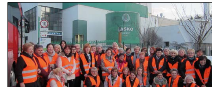
Draženčanke so ob dnevu žena obiskale Pivovarno Laško.